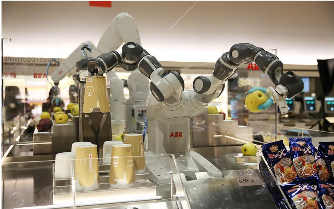
Рис. 2. Багатофункціональний робот-маніпулятор у ролі продавця супермаркету

Супермаркет майбутнього дасть можливість купувати різні продукти простим і швидким способом як у реальному магазині, так і через інтернет. На відміну від людської праці роботи-маніпулятори відкривають власникам супермаркетів можливість здійснювати продаж будь-яких продуктів без обмеження за формою, вагою і крихкості, гарантуючи цілісність товару під час продажу. При цьому людська праця повинна бути перекваліфікована у напрямку управління такими високотехнологічними рішеннями (рис. 3).