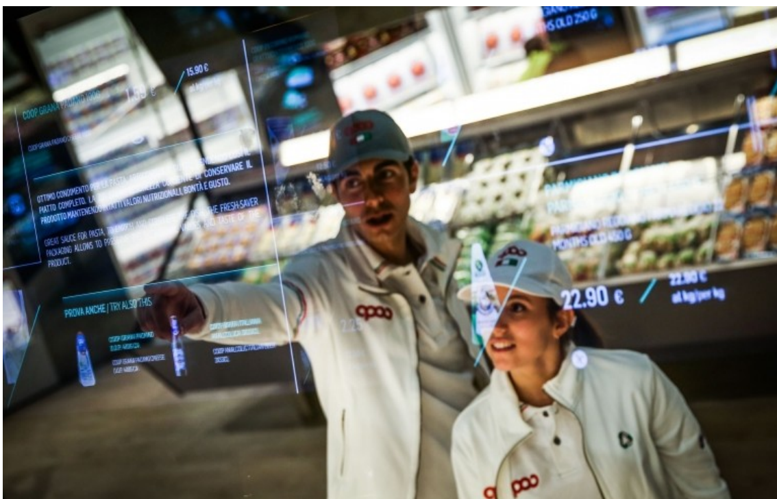
Рис. 3. High-tech manager – новий вид професії

Супермаркет майбутнього дасть можливість купувати різні продукти простим і швидким способом як у реальному магазині, так і через інтернет. На відміну від людської праці роботи-маніпулятори відкривають власникам супермаркетів можливість здійснювати продаж будь-яких продуктів без обмеження за формою, вагою і крихкості, гарантуючи цілісність товару під час продажу. При цьому людська праця повинна бути перекваліфікована у напрямку управління такими високотехнологічними рішеннями (рис. 3).